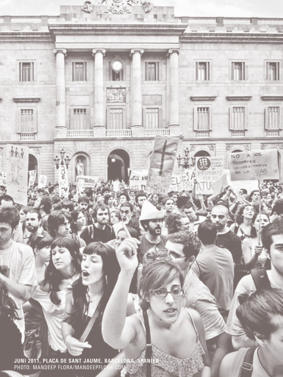
JUNI 2011, PLACA DE SANT JAUME, BARCELONA, SPANIEN